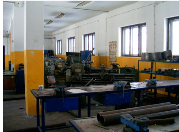
Радионица за машинску обраду