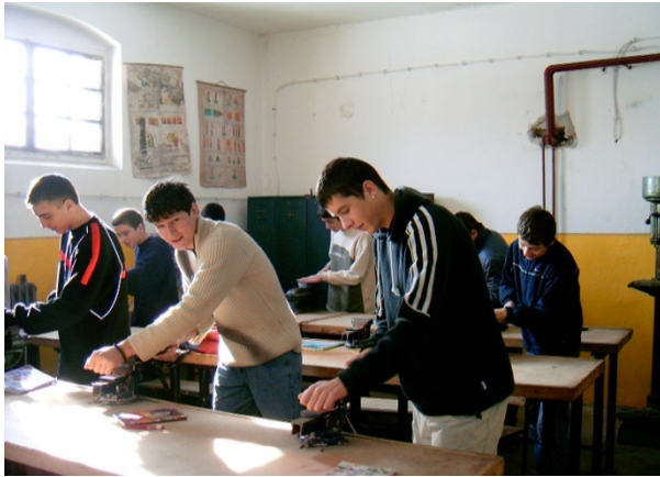
Радионица за ручну обраду