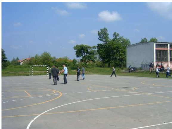
Отворени спортски терени

Школа поседује спортску салу, отворене спортске терене за рукомет, кошарку и одбојку.